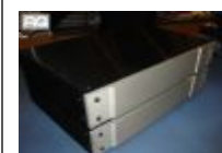
Pre-amplificatori Pass Labs X-ono € 2.900,00